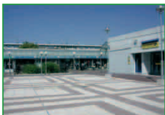
Centre commercial Obélisque et la nouvelle Poste