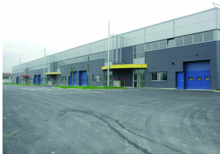
ZAC du Bois Moussay

Cette zone est une réelle opportunité de développement économique pour la ville mais aussi d'accès à l'emploi pour ses habitants. Elle est desservie par le métro Saint-Denis Université (Métro ligne 13) ou par la gare de Pierrefitte-sur-Seine (RER D). Par ailleurs, la zone du Bois Moussay sera desservie par la tangentielle nord qui reliera les gares RER de Noisy-le-Sec à Sartrouville en passant par Stains en 2014.