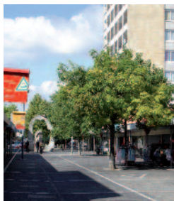
Centre commercial des Tilleuls